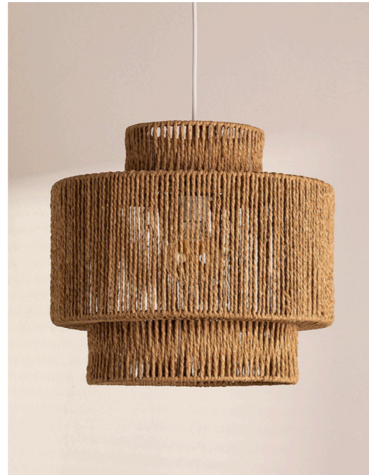
KENA / PLAFONNIER EN PAPIER TRESSÉ KENA

HTTPS://WWW.SKULUM.COM/FR/ACHETER-SUSPENSION/66098-PLAFONNIER-EN-PAPIER-TRESSE-KE-NA.HTML?ID_C=131483&GAD_SOURCE=1&G-BRAID=0AAAAADMZ35JBECYEE5RCMHPR_DK4VR-7VG&GCLID=CJWKCAJW5QC2BHB8EIWAVQA-41TONUANWMECBHOSWLSN6EKJOLKR8KH-XPTEQJKBORFLPYLDQQVGBGOCGDWQAVD_BWE