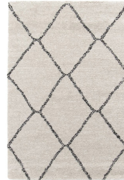
TAPIS INTÉRIEUR SHAGGY, STYLE BERBÈRE, BLANC ET NOIR JESSIE 160X230CM

HTTPS://WWW.LAREDOUTE.FR/PPDP/PROD-601675690.ASPX#SEARCHKEYWORD=TAPIS%20NOIR%20ET%20BLANC&SHOPPINGTOOL=SEARCH