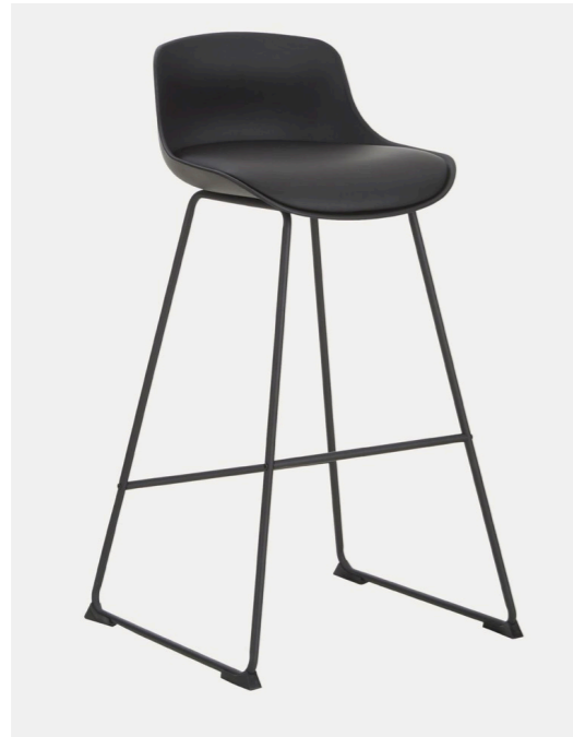
CHAISES DE BAR EN CUIR SYNTHÉTIQUE TINA, 2 PIÈCES

HTTPS://WWW.WESTWING.FR/TA-BOURETS-DE-BAR-EN-CUIR-SYNTHETIQUE-TINA-2-PIECES-119464.html?simple=DEQ19ACT77122-150582&utm_source=GOOGLE&utm_medium=SEA_CONVERSION_NBR&utm_campaign=FR_PERFORMAN-CEMAX_NBR_ADF&utm_content=&utm_source=1&utm_medium=0AAAAADZC_7_UH-CY45FACQ0SH8PZCWSCE&utm_campaign=CJWK-CAJW5QC2BHB8EIWAVQA419-QZHRX9B-DMWIN0STDKYYLNZL1YANDJLKDVCSTP-5NOLTR70CADHOC-YGOAVD_BWE