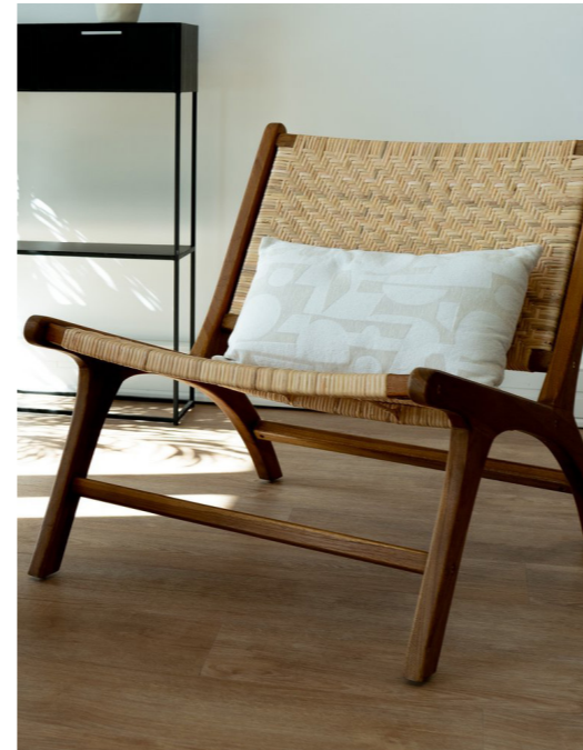
FAUTEUIL EN TECK ET TRESSAGE CANNAGE EN ROTIN - KILKA

HTTPS://WWW.LAREDOUTE.FR/PPDP/PROD-560867370.ASPX?DIM1=1000&DIM2=1999&DOCID=00000000000001&CO-D=PSN00094581FR&GAD_SOURCE=1&G-BRAID=0AAAAADYKRSPQWS-I5TTQ8Z_4H34DZTULEU&GCLID=CJWK-CAJW5QC2BHB8EIWAVQA41QNO_CPE-DE-JQR15KNYCXL7DOZU7_BSNHZGSPVKQOXIVF-TNOBMLXOCCI4QAVD_BWE