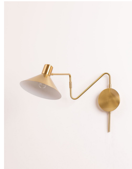
LIZZ APPLIQUE MÉTALLISÉE LIZZ

HTTPS://WWW.SKULUM.COM/FR/ACHETER-MUR/98458-APPLIQUE-MURALE-METALLIQUE-LIZZ.HTML?ID_C=193917&GAD_SOURCE=1&GBRAID=0AAAAAD-MZ35JBECYEE5RCMHPR_DK4VR7VG&GCLID=CJWKCAJW5QC2BHB8E1WAVQA-41ROFLSF2NXGXATXC4IYS7MAHR3JUJPNICBLTI-J1UNAXANQFU9JUEYBOCTD0QAVD_BWE