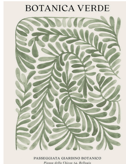
BOTANICA VERDE AFFICHE 50X70

HTTPS://DESENI0.FR/P/AFFICHES/ART-ET-ILLUSTRATION/AQUARELLE/BOTANICA-VERDE-AFFICHE/