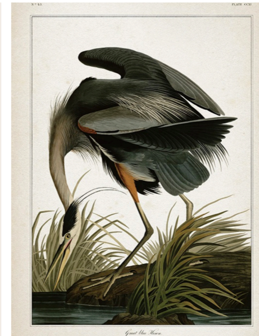
GREAT BLUE HERON AFFICHE

HTTPS://DESENI0.FR/P/AFFICHES/VINTAGE-AFFICHES/GREAT-BLUE-HERON-AFFICHE/