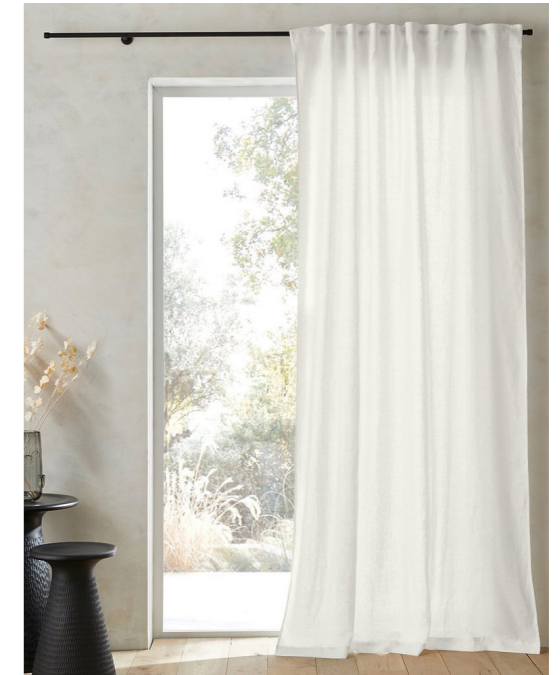
RIDEAU LIN LAVÉ RUFLETTES, PRIVATE

HTTPS://WWW.LAREDOUTE.FR/PPDP/PROD-544858286.ASPX?DIM1=1004&DIM2=1002&DOCID=00000000000001&CO-D=PSN00094578FR&GAD_SOURCE=1&G-BRAID=0AAAAADYKRSQEBHOT-FB_ZTH315L7PFQNKQ&GCLID=CJWK-CAJW5QC2BHB8EIWAVQA41O-TUV-K6O6USEEGLLCOU-WK3LGKCBMYMJTRWLSQ0X-Q0C1QWCQTUHKHOCNKEQAVD_BWE